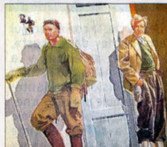
Des figures de l'alpinisme qui seront "installées" en Haute-Savoie à partir du 19 juillet.

Se connecter sur le site www.a-fresco.com