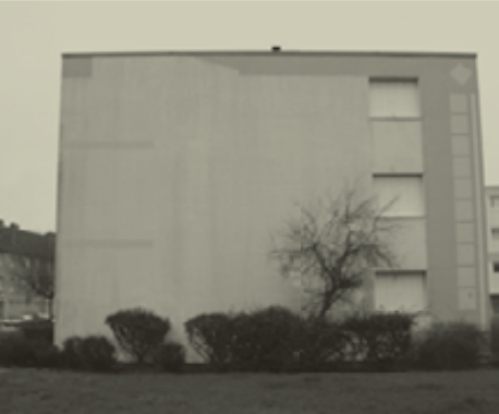
Bel Air avant la réalisation des fresques.

Pour chaque bâtiment, plusieurs réunions ont permis aux habitants de donner leur avis et choisir eux-mêmes parmi les maquettes proposées par les muralistes de Cité Création.