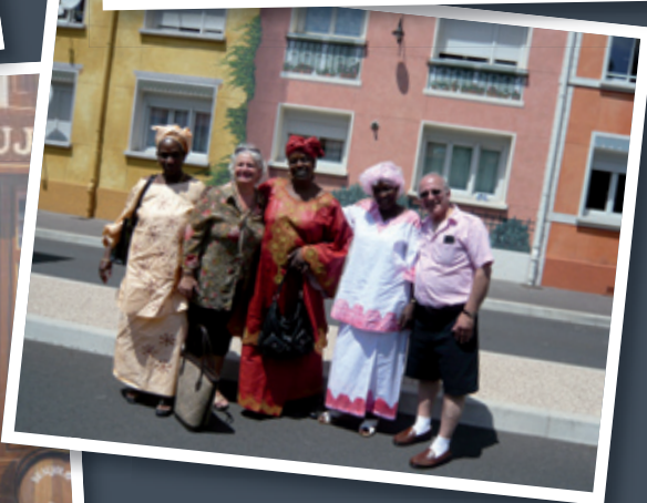
Un Chartrain : « À Lyon, en voyant toutes ces fresques, on a commencé à croire au Père Noël... »