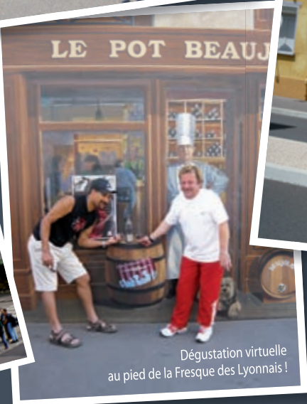
Dégustation virtuelle au pied de la Fresque des Lyonnais !