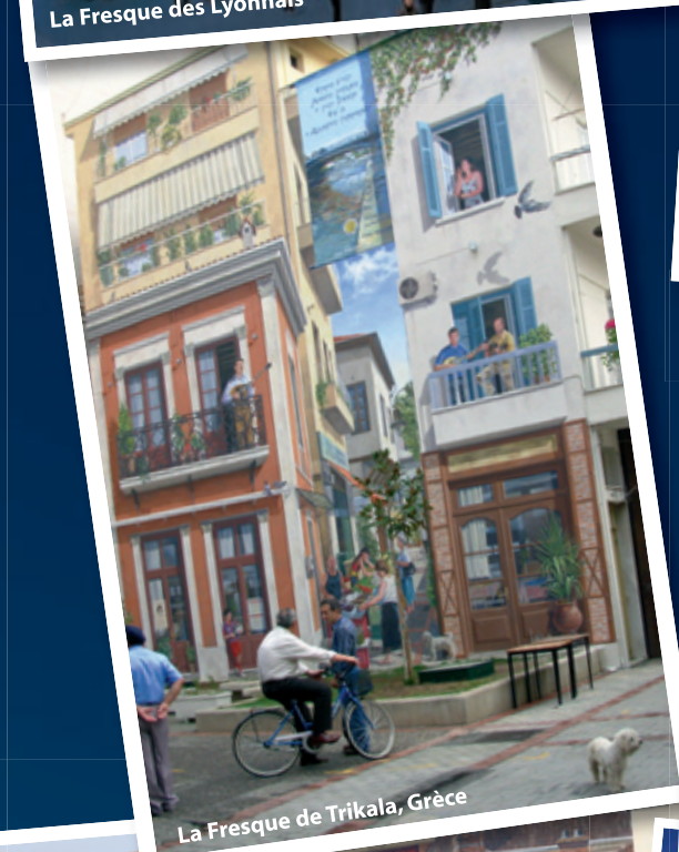
La Fresque de Trikala, Grèce