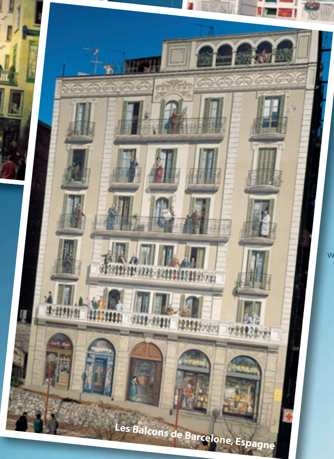
Les Balcons de Barcelone, Espagne

Les fresques de Cité Création répondent à de multiples besoins et intérêts urbanistiques et socio-économiques. Elles perpétuent des mémoires et favorisent un développement culturel durable.