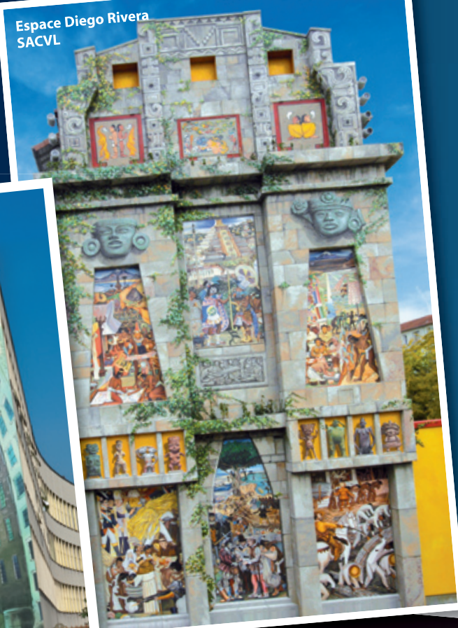
Espace Diego Rivera SACVL