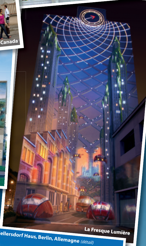
La Fresque Lumière