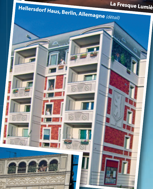
Hellersdorf Haus, Berlin, Allemagne (détail)