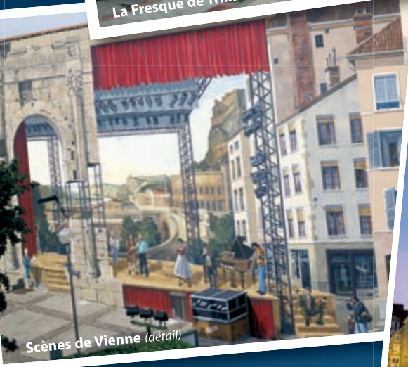
Scènes de Vienne (détail)