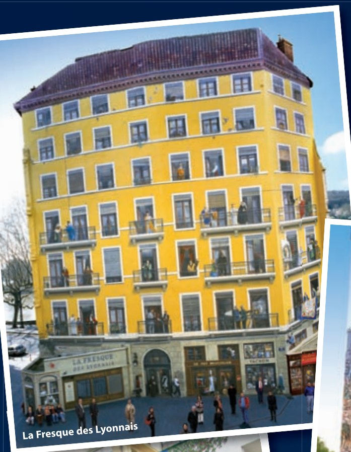
La Fresque des Lyonnais

L'entreprise Cité Création a signé plus de 460 œuvres monumentales aux couleurs des villes de Lyon, de Barcelone, de Mexico, d'Angoulême, Mulhouse, Naples, Biarritz, Marseille, Tibériade, Brest, Paris, Carcassonne, Lisbonne, Porto, Valence, Vienne, Namur, Trikala, Leipzig, Berlin, Jérusalem, Moscou, Yokohama, Shanghai, Québec... et maintenant Chartres !