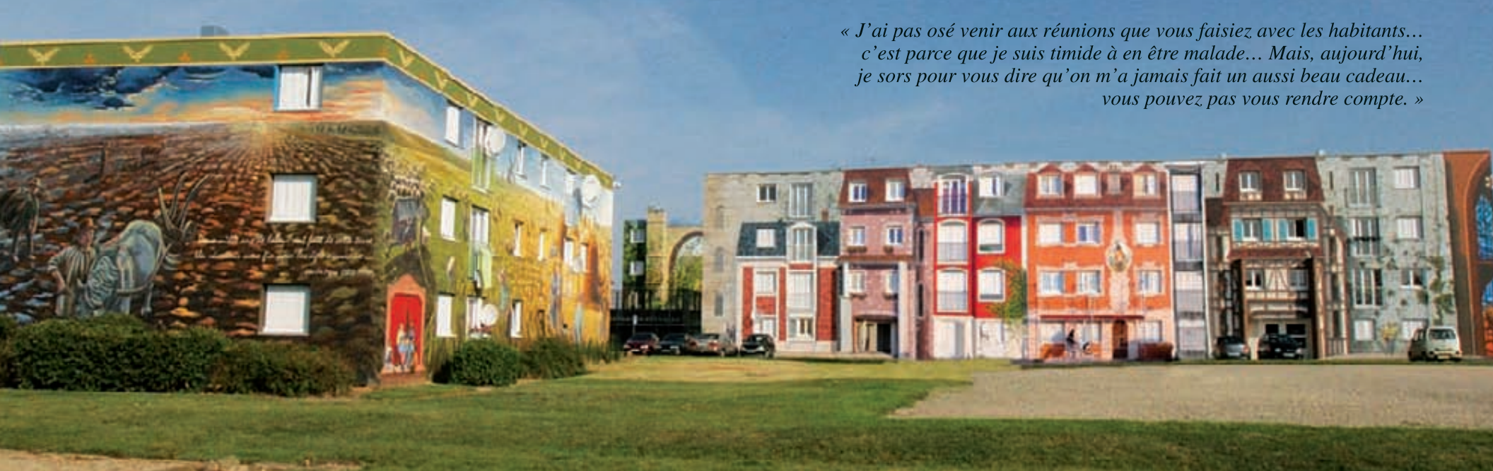
« J'ai pas osé venir aux réunions que vous faisiez avec les habitants... c'est parce que je suis timide à en être malade... Mais, aujourd'hui, je sors pour vous dire qu'on m'a jamais fait un aussi beau cadeau... vous pouvez pas vous rendre compte. »