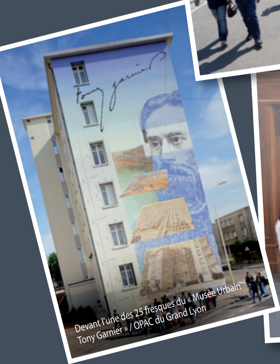
Devant l'une des 25 fresques du « Musée Urbain Tony Garnier » / OPAC du Grand Lyon