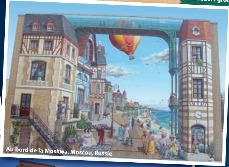
Au bord de la Moskwa, Moscou, Russie