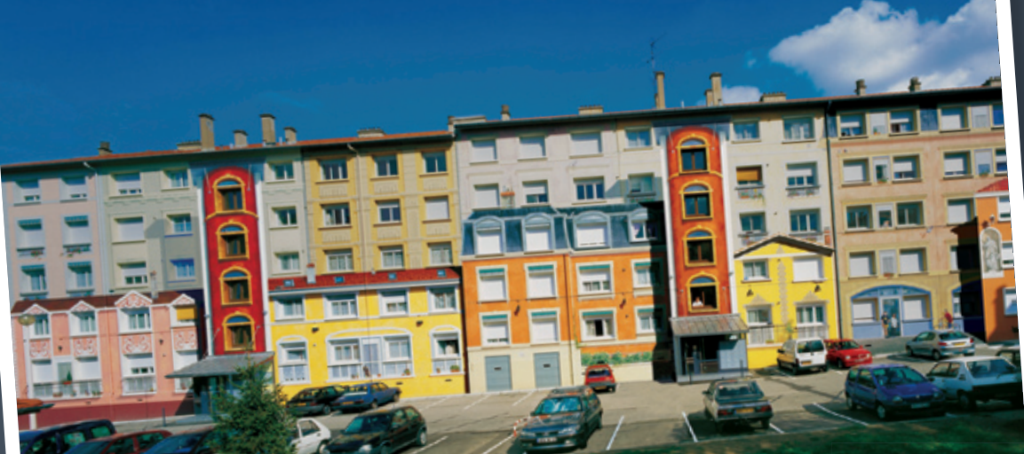
Découverte des fresques sur les HLM de la Sarra, à Lyon, transformées en petit village par Cité Création, à l'initiative de la SACVL le propriétaire.