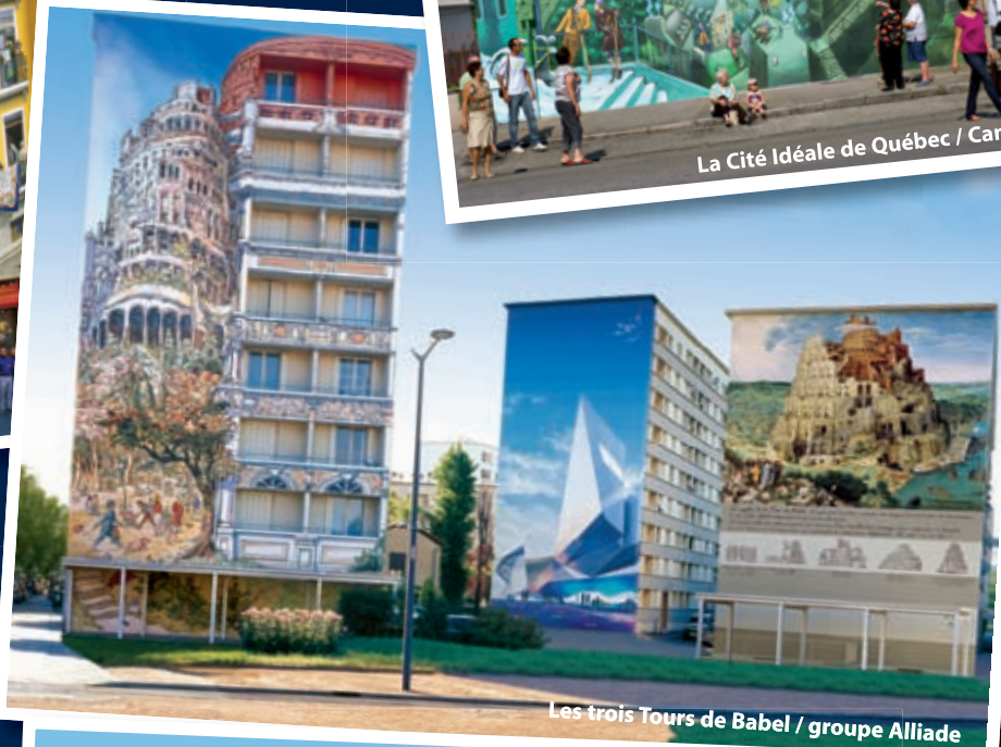
Les trois Tours de Babel / groupe Alliade