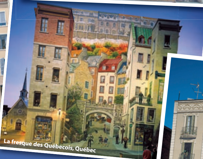
La fresque des Québécois, Québec