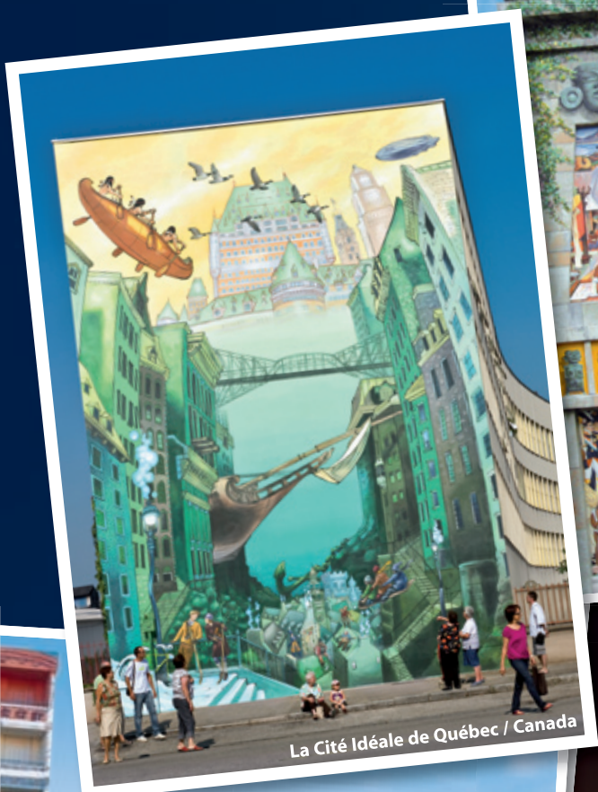
La Cité Idéale de Québec / Canada