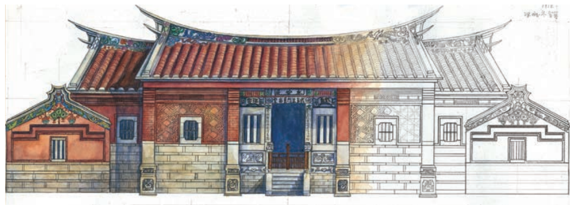
Li-Chun Chien - École Émile Cohl