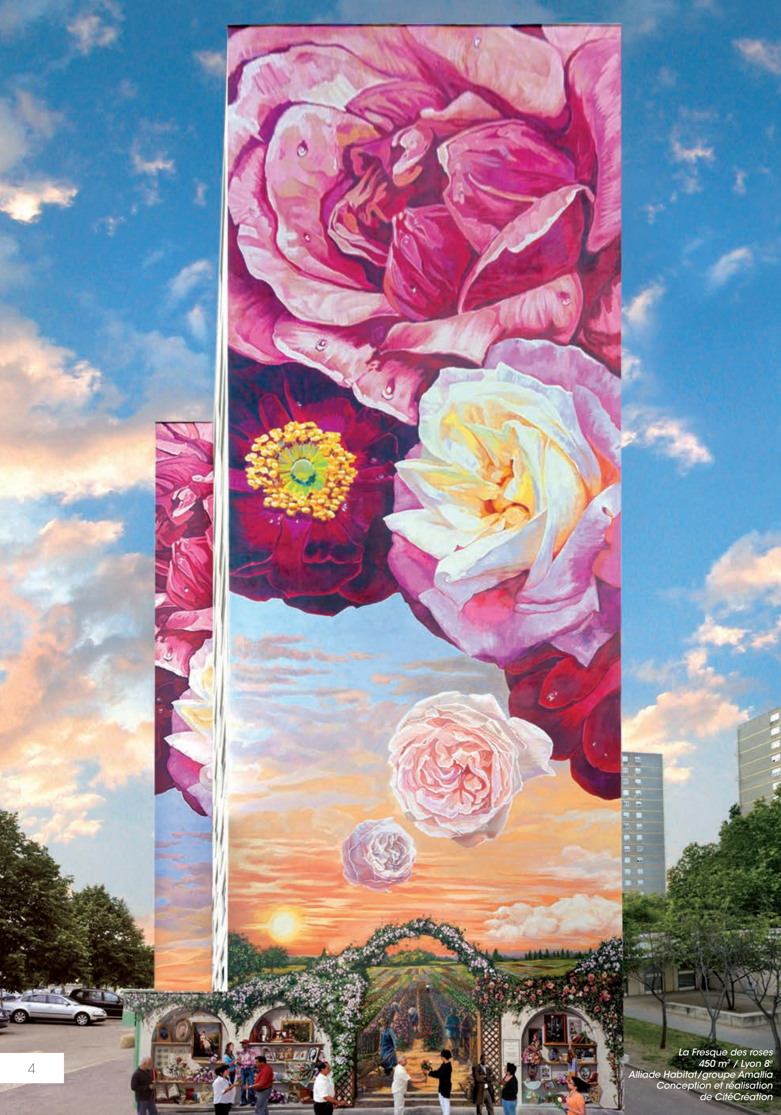
La Fresque des roses 450 m 2 / Lyon 8 e Alliade Habitat/groupe Amallia Conception et réalisation de CitéCréation