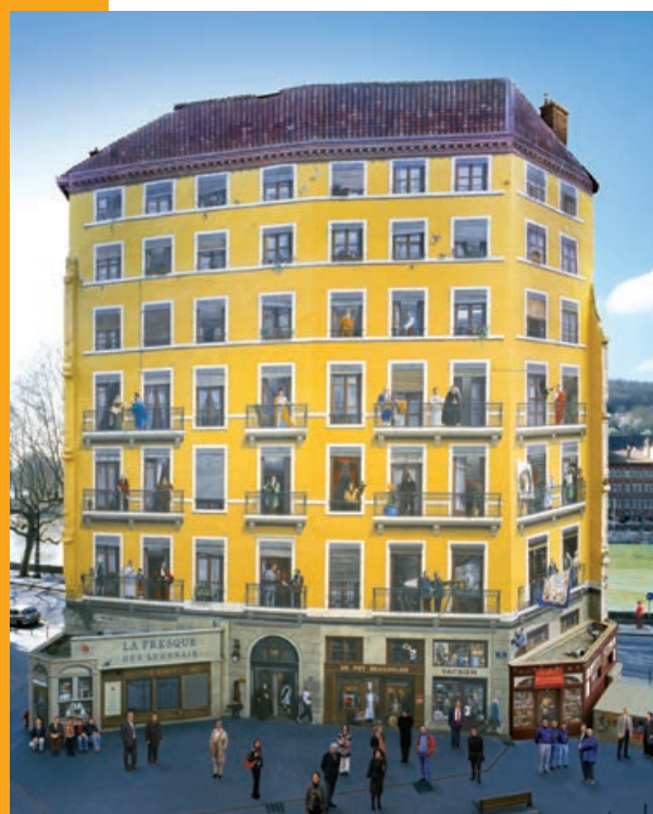
La Fresque des Lyonnais 800 m 2 - Lyon 1 er Conception et réalisation de CitéCréation