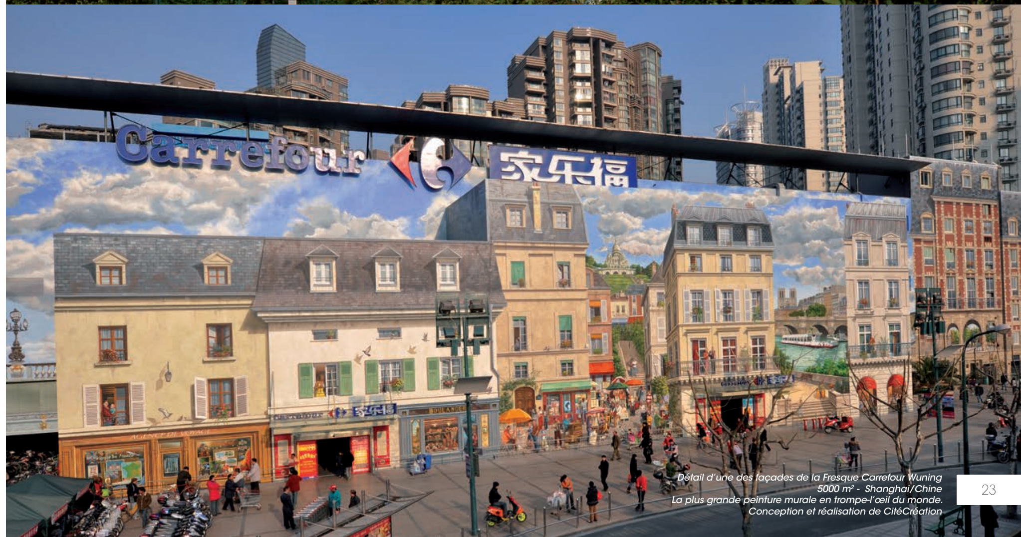
Détail d'une des façades de la Fresque Carrefour Wuning 5000 m 2 - Shanghai/Chine La plus grande peinture murale en trompe-l'œil du monde. Conception et réalisation de CitéCréation