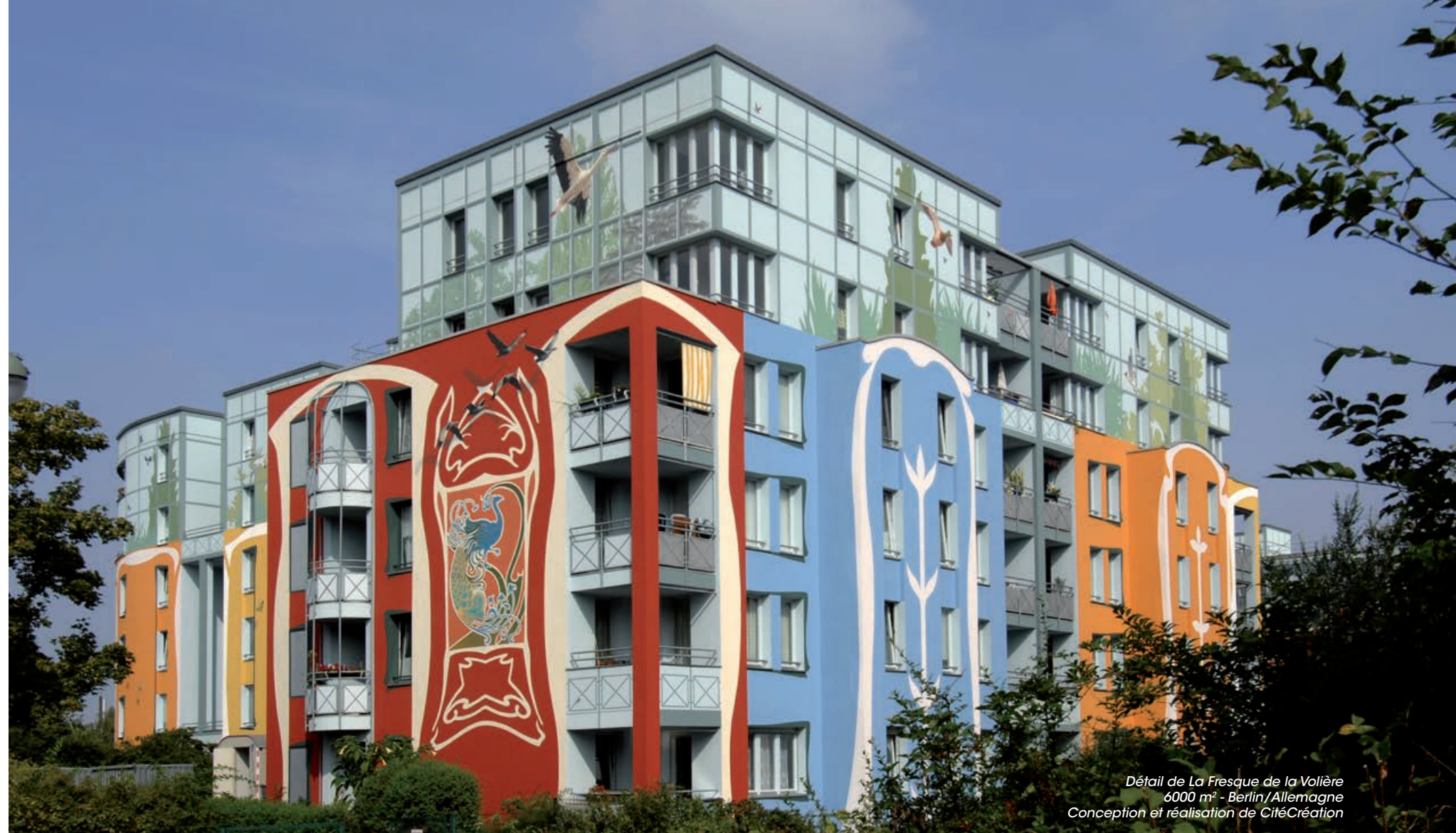
Détail de La Fresque de la Volière 6000 m 2 - Berlin/Allemagne Conception et réalisation de CitéCréation