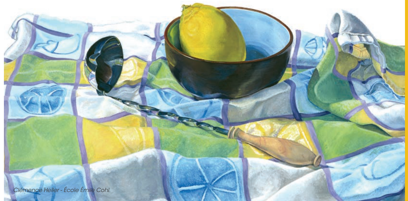
Clémence Heller - École Émile Cohl