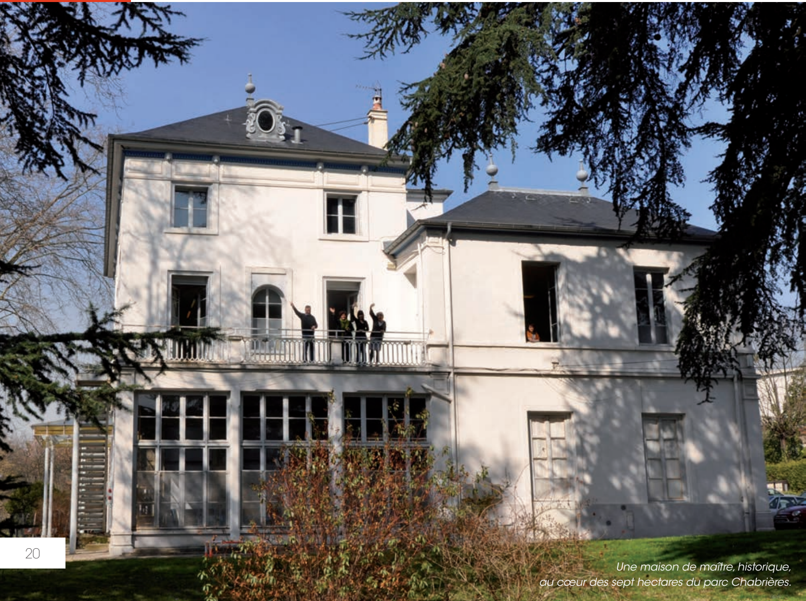
Une maison de maître, historique, au cœur des sept hectares du parc Chabrières.

Par ailleurs, des partenaires privés , entreprises, sociétés et particuliers mécènes, en soutien à l'animation d'ÉCohlCité et à ses étudiants, sont regroupés dans la Fondation Savoir-Fresques , sous l'égide de la Fondation Rhône-Alpes Futur.