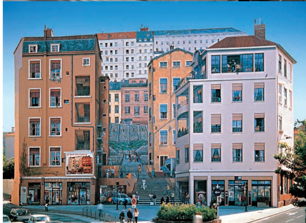
Le Mur des Canuts 1200 m 2 - Lyon 4 e Conception et réalisation de CitéCréation