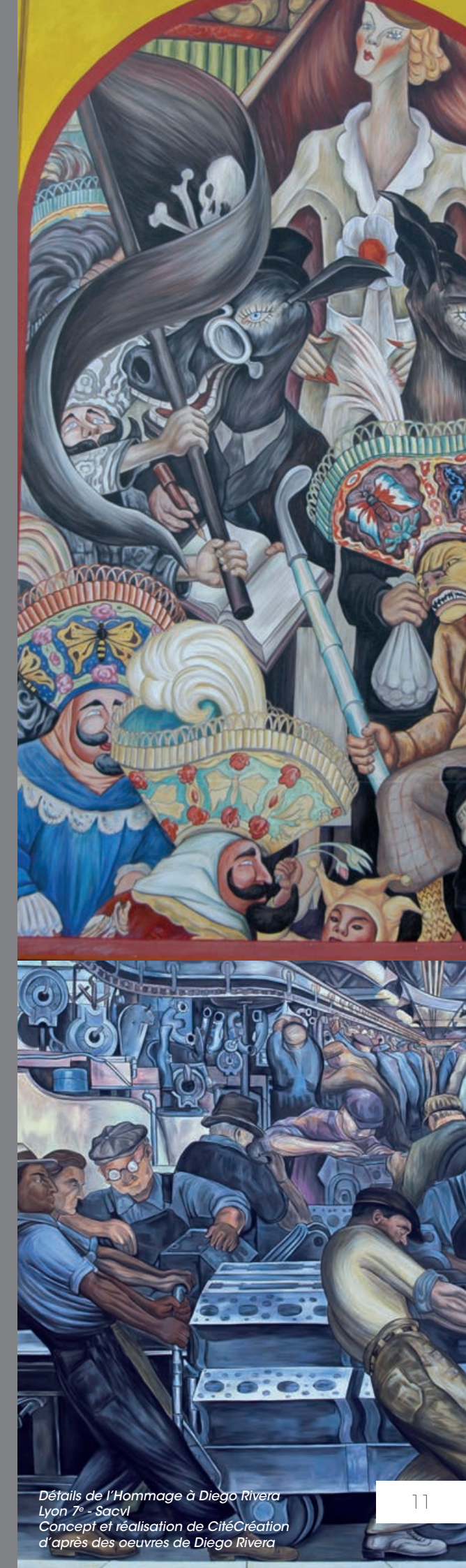
Détails de l'Hommage à Diego Rivera Lyon 7 e - Sacvl Concept et réalisation de CitéCréation d'après des œuvres de Diego Rivera

15. La finalité d'ÉCohlCité est d'imposer au monde de la décoration urbaine une éthique professionnelle et civique fondée sur la recherche de l'altérité et du sens.